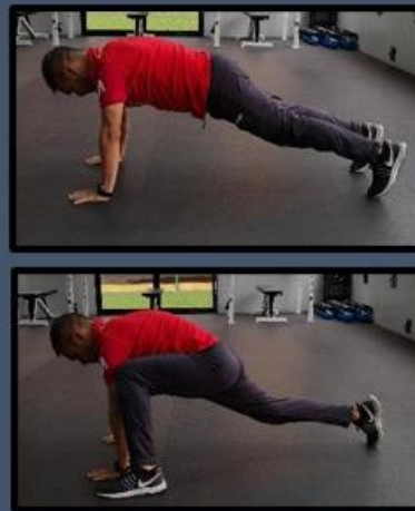
Spiderman Apoyo en Manos