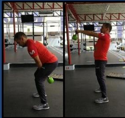
Swing de cadera con carga