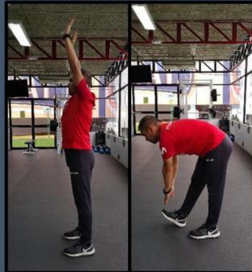
Toco Cielo, Toco Pie