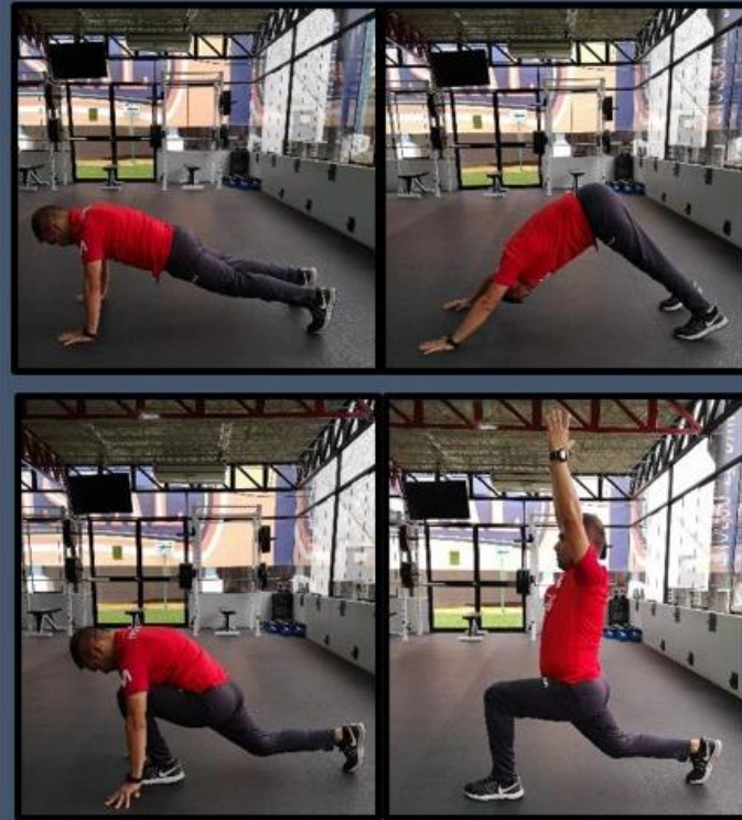
Carpa + Guerrero