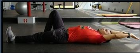
Abdominal corto brazo extendido