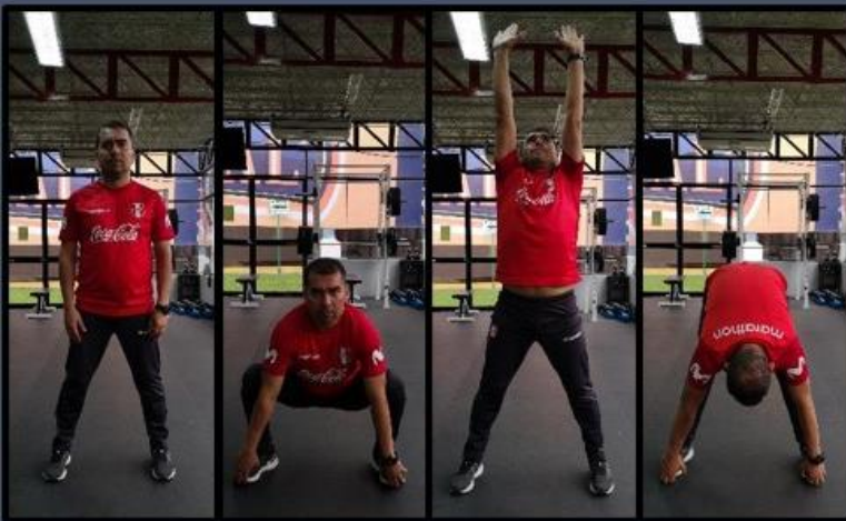
Sentadilla Sumo + Toco el Cielo