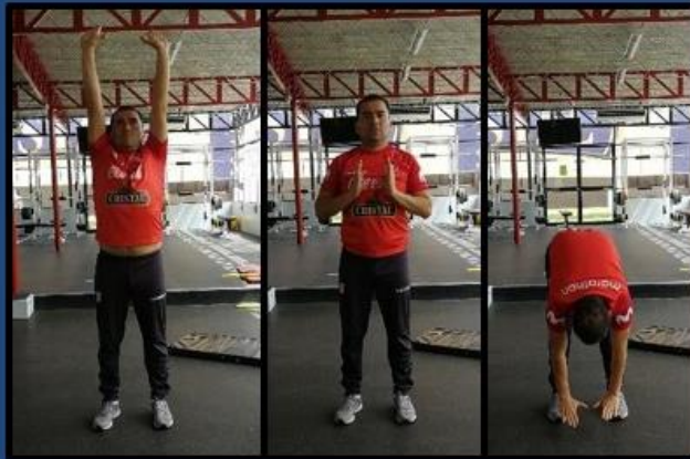
Empuje arriba, empuje abajo