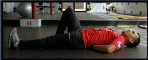
Abdominal corto brazo flexionado